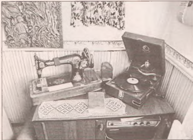
■ Швейная машинка соседствует с патефоном — их подарили жители Новинки

«Краеведение в разных местах принимает разные формы, акценты выделяются также различные. Здесь меня особенно привлекает традиция, заложенная Г.Я. Пудышевым, — ставить в центр внимания не просто людей, а людей под углом зрения их семейного уклада. Для краеведа были важны родственные отношения, генеалогия. Это замечательно. 16 марта 2016 г.».