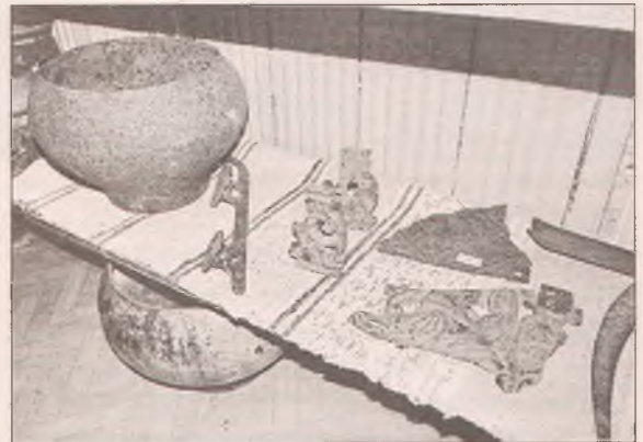
■ Одни из первых экспонатов — свидетели прошлой жизни старинной деревни

В самом деле, не только музеем славится Новинская библиотека. Её знаменитые посиделки, на которых старшее поколение обучало моло-