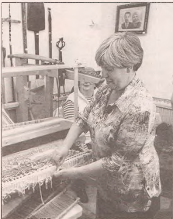
■ Ткацкий станок теперь предмет музейной экспозиции